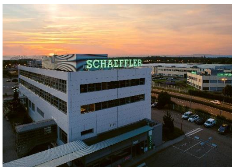
Site de Haguenau, siège de Schaeffler France.

Schaeffler a ouvert son premier bureau de ventes à Paris en 1956. Deux ans plus tard, la première usine du groupe en France voyait le jour dans la ville alsacienne de Haguenau. Depuis, l'entreprise n'a cessé de se développer jusqu'à devenir l'une des 50 premières entreprises industrielles du pays. Schaeffler France a actuellement son siège à Haguenau en Alsace, où se situe la majorité de ses activités industrielles. La présence dans le pays est actuellement complétée par deux autres usines, à Chevilly et Chambéry, ainsi que plusieurs centres de R&D et bureaux commerciaux à travers le pays. Le groupe Schaeffler emploie actuellement environ 1 800 personnes en France.